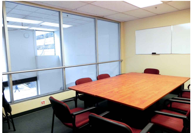
(プロフェッショナルキャンパスの教室)

大きな窓から光がはいる、とってもお洒落なキャンパスです。 お近くにお寄りの際は、ぜひ一度お立ち寄りくださいね。 それでは写真で少しだけ、2つのキャンパスをご紹介します!